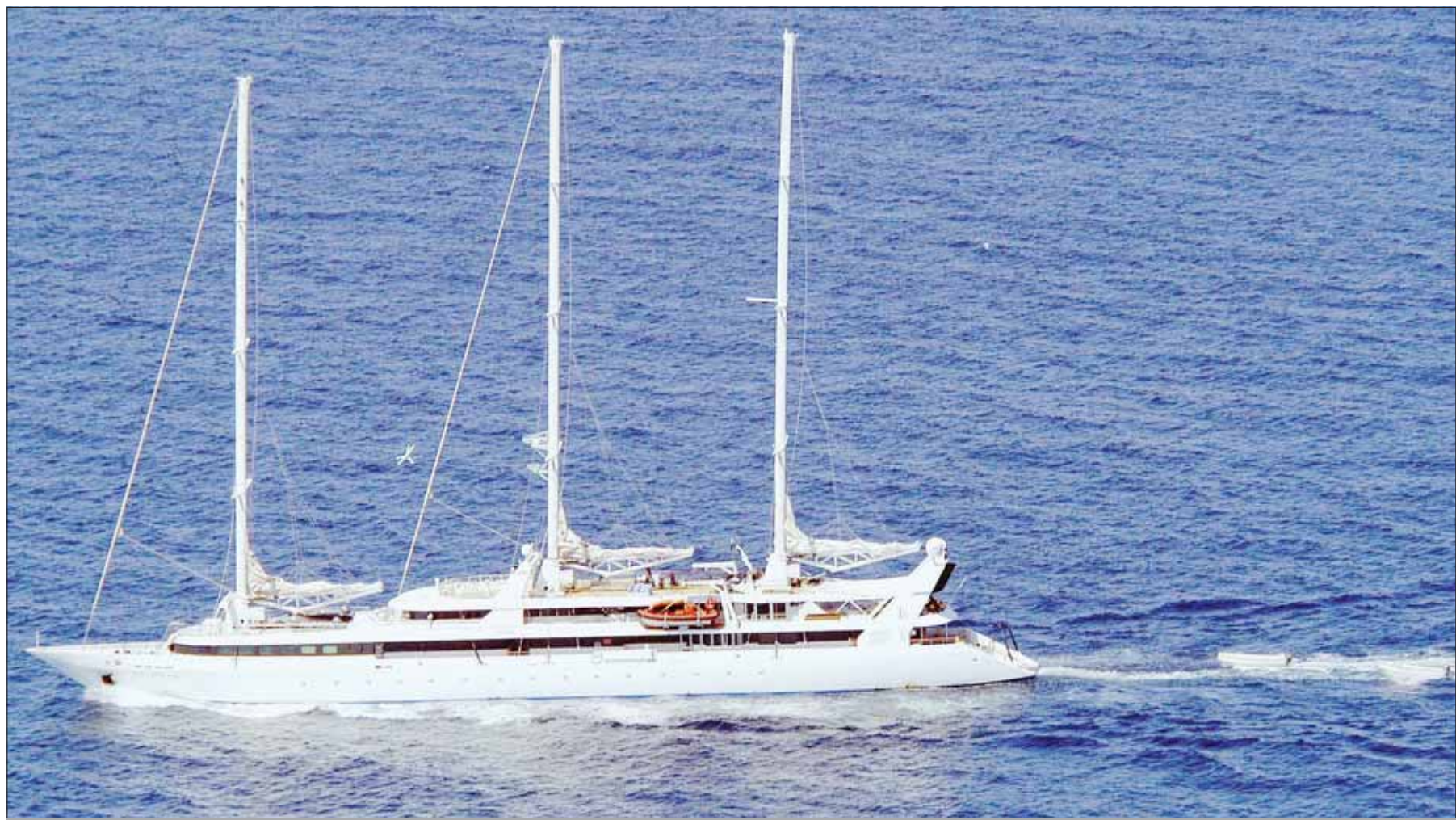
Le ministre des Affaires étrangères et l'armateur CMA CGM l'ont réaffirmé hier : ils veulent trouver une solution négociée au détournement du "Ponant".

Il y restera "prépositionnée", à un millier de kilomètres de Garaad, le port somalien devant lequel le Ponant est au mouillage depuis dimanche soir. L'équipe de gendarmes d'élite a été déployée dans le cadre du plan Pirate-mer , déclenché vendredi par François Fillon après la capture du Ponant . Ce plan mobilise également des unités de commandos de marine. "Il n'est pas prévu qu'ils embarquent à bord d'un navire de la Marine nationale pour le moment", a précisé une source proche du dossier.